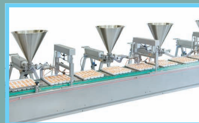
Automatische Produktion über Förderband