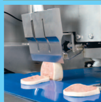
Eine spezifische Lösung für den Kunde