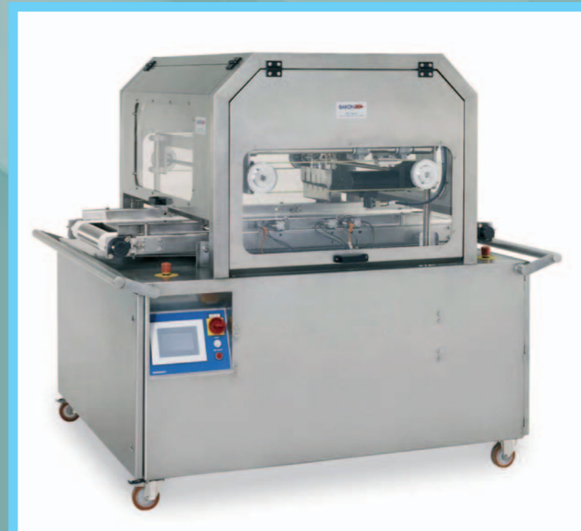
Schneidemaschine für rechteckige Produkte (mit oder ohne Backbleche)