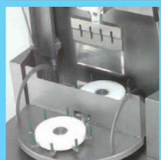
Schneidemaschine für runde Produkte